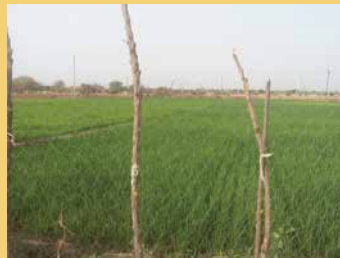
Crédit intrant maraîchage